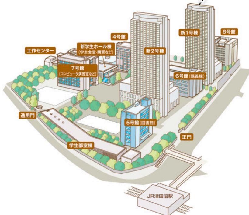
津田沼校舎 配置図