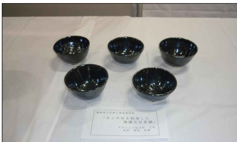
◎最優秀賞 No.4「ホッキ貝を利用した油滴天目茶碗」 福島県立会津工業高等学校

2013年3月17日から19日に東京工業大学で開催された2013年年会には、愛知県立瀬戸窯業高等学校、岐阜県立多治見工業高等学校、滋賀県立信楽高等学校、愛知県立常滑高等学校、大阪市立泉尾工業高等学校、佐賀県立有田工業高等学校、福島県立会津工業高等学校からの出展がありました。来場者の投票により、最優秀賞2点 優秀賞1点が選出され、投票総数は132でした。最優秀賞、優秀賞および全作品は以下の通りです。