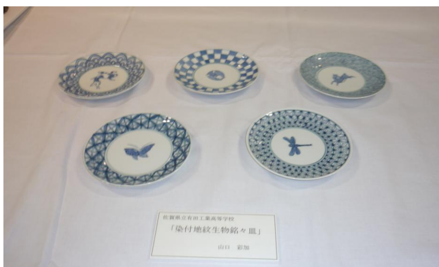
◎最優秀賞 No.6「染付地紋生物銘々皿」 佐賀県立有田工業高等学校