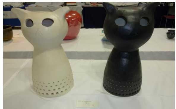
No.17 「輝る」 愛知県立瀬戸窯業高等学校