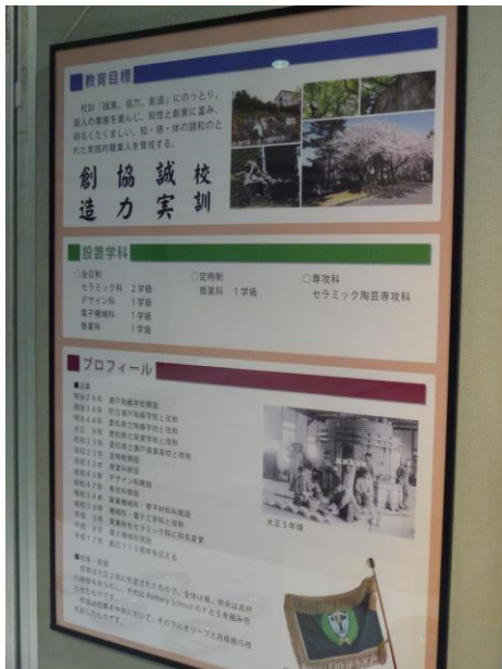
学校紹介(教育目標・設置学科・プロフィール) 愛知県立瀬戸窯業高等学校

同じく、愛知県立瀬戸窯業高等学校、岐阜県立多治見工業高等学校、佐賀県立有田工業高等学校からポスターの出展がありました。全作品は以下の通りです。