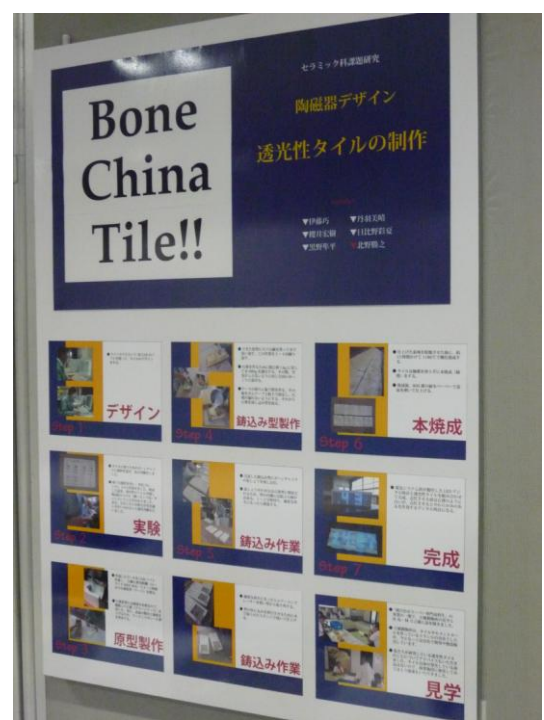
Bone China Tile!! 陶磁器デザイン 透光性タイルの制作 (セラミック科課題研究) 岐阜県立多治見工業高等学校