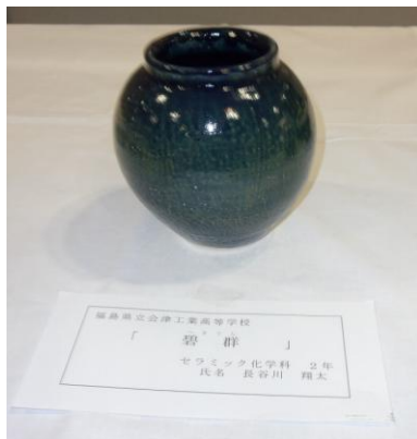
No.5 「碧群」 福島県立会津工業高等学校