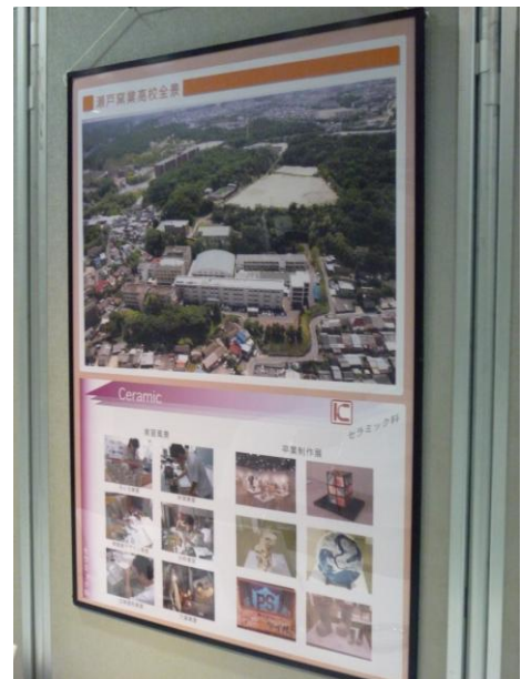
学校紹介(全景・セラミック科紹介) 愛知県立瀬戸窯業高等学校