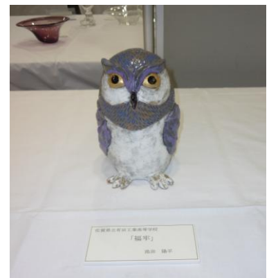
No.8 「福牟」 佐賀県立有田工業高等学校