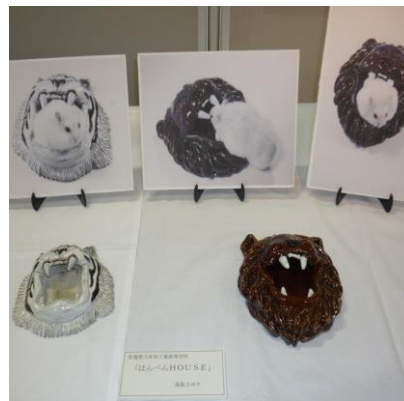
No.7 「はんぺんHOUSE」 佐賀県立有田工業高等学校