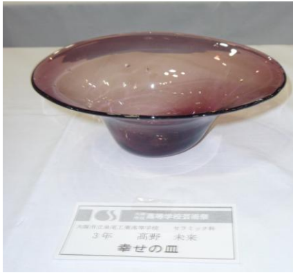
No.9 「幸せの皿」 大阪市立泉尾工業高等学校