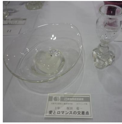
No.10 「愛とロマンスの交差点」 大阪市立泉尾工業高等学校