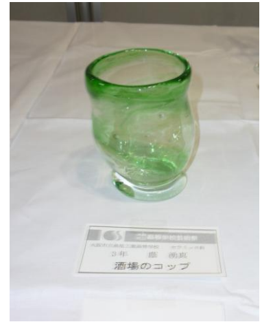
No.14 「酒場のコップ」 大阪市立泉尾工業高等学校