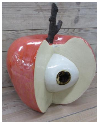
No.2 「果実の視線」(オブジェ) 岐阜県立多治見工業高等学校