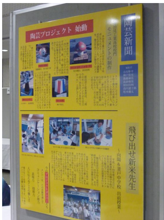
陶芸新聞 多治見工業高校校門モニュメントの制作 ～陶芸プロジェクト始動～ 岐阜県立多治見工業高等学校