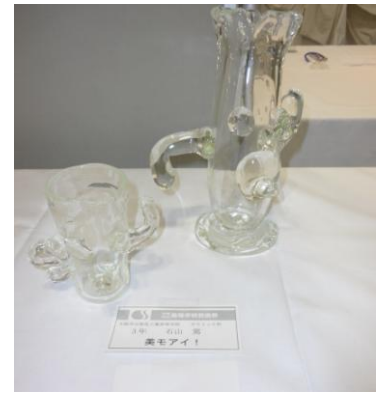
No.11 「美モアイ！」 大阪市立泉尾工業高等学校