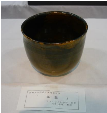
No.1 「郷愁」 福島県立会津工業高等学校