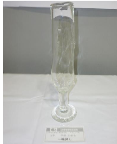
No.13 「一輪挿し」 大阪市立泉尾工業高等学校