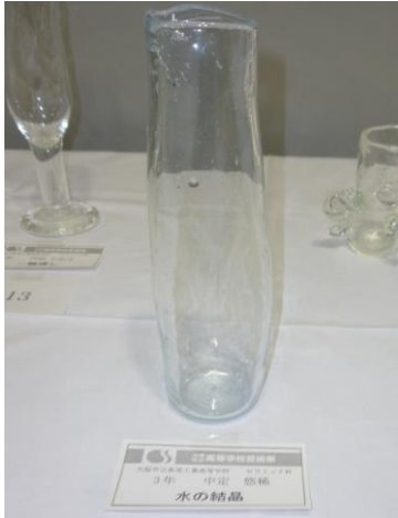
No.12 「水の結晶」 大阪市立泉尾工業高等学校