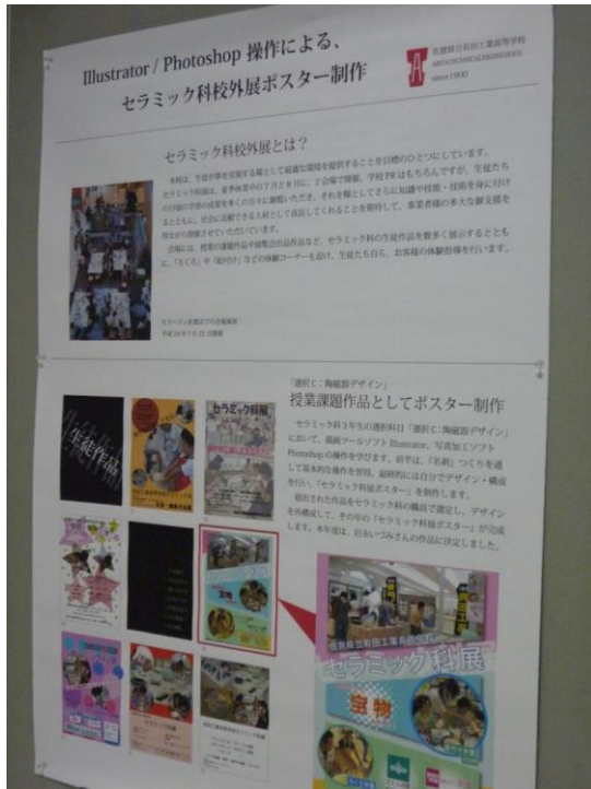
陶磁器デザイン Illustrator・Photoshop 操作による ポスター制作～セラミック科校外展に向けて～ 佐賀県立有田工業高等学校