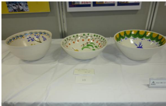
No.15 「MAJOLICA」 愛知県立瀬戸窯業高等学校