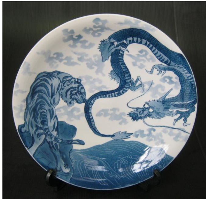
○優秀賞 No.16 「竜壤虎博」 愛知県立瀬戸窯業高等学校