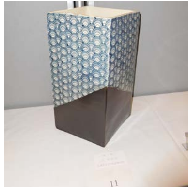
No.11 「光と影」 長崎県立波佐見高等学校