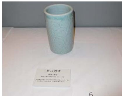
No.6 「ヒルガオ」 愛知県立瀬戸窯業高等学校