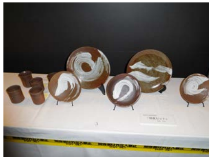
No.3 「朝食セット」 愛知県立常滑高等学校