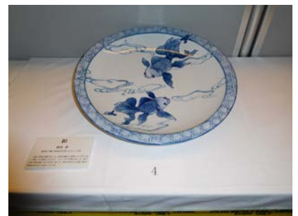
No.4 「和」 愛知県立瀬戸窯業高等学校