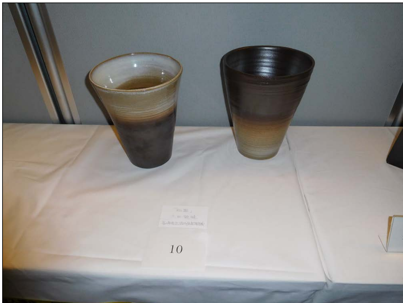
◎最優秀賞 No.10「和器」 長崎県立波佐見高等学校

2016年3月14日から16日に早稲田大学で開催された2016年年会には、愛知県立瀬戸窯業高等学校、岐阜県立多治見工業高等学校、愛知県立常滑高等学校、大阪市立泉尾工業高等学校、佐賀県立有田工業高等学校、福島県立会津工業高等学校、滋賀県立信楽高等学校、長崎県立波佐見高等学校からの出展がありました。来場者の投票により、最優秀賞1点 優秀賞3点が選出され、投票総数は467でした。最優秀賞、優秀賞および全作品は以下の通りです。