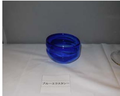
No.14 「ブルーエクスタシー」 大阪市立泉尾工業高等学校