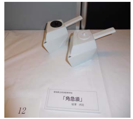
No.12 「角急須」 愛知県立常滑高等学校