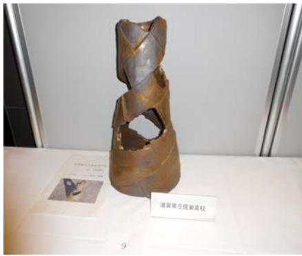
No.9 「記憶」 滋賀県立信楽高等学校