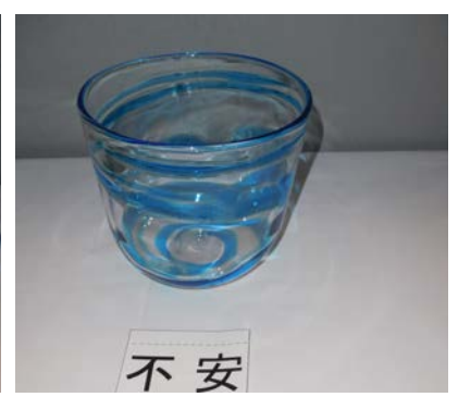
No.18 「不安」 大阪市立泉尾工業高等学校