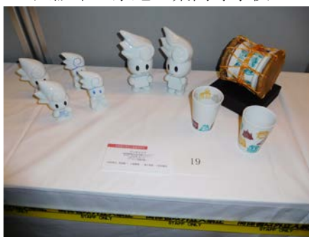
No.19 「アリタミヤゲ」 佐賀県立有田工業高等学校