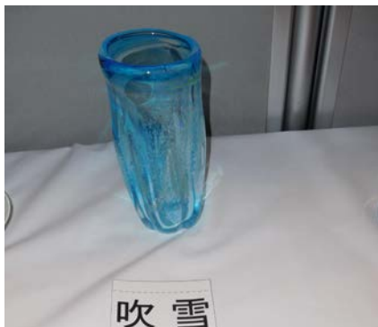
No.16 「吹雪」 大阪市立泉尾工業高等学校