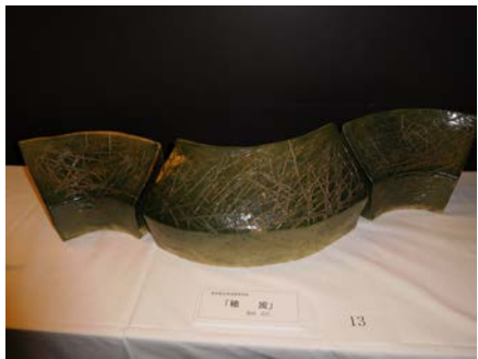
No.13 「穂波」 愛知県立常滑高等学校