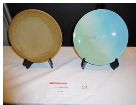
No.20 「ロクロ最後の作品」 佐賀県立有田工業高等学校