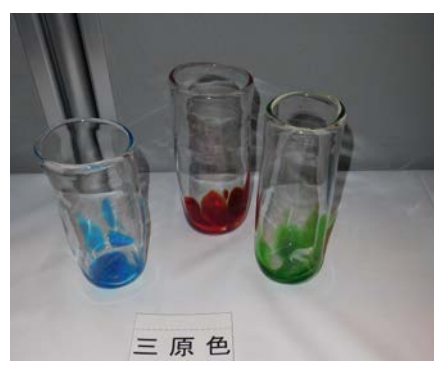
No.17 「三原色」 大阪市立泉尾工業高等学校