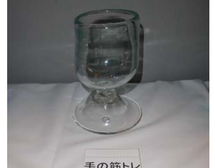
No.15 「手の筋トレ」 大阪市立泉尾工業高等学校