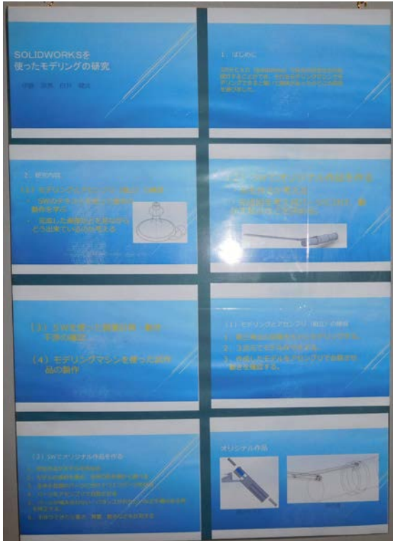
○ SOLIDWORKSを使ったモデリングの研究（愛知県立常滑高等学校）

同じく、愛知県立常滑高等学校、岐阜県立多治見工業高等学校、滋賀県立信楽高等学校、佐賀県立有田工業高等学校からポスター（パネル）の出展がありました。全作品は以下の通りです。