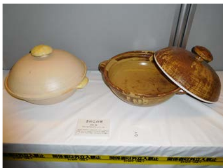
No.5 「きのこの里」 愛知県立瀬戸窯業高等学校