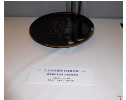
No.7 「たじみそ焼きそば専用皿」 岐阜県立多治見工業高等学校