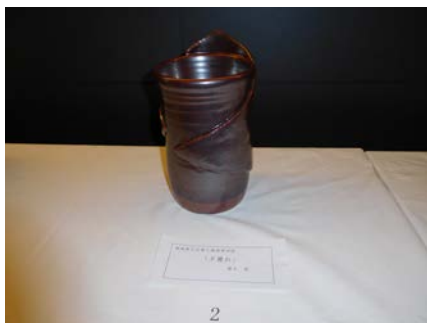
No.2 「夕暮れ」 福島県立会津工業高等学校