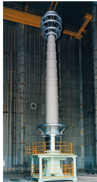
図3 1000kV 級ブッシング

右から機械強度 165, 210, 330, 420, 530, 680, 820kN の懸垂碍子（笠の直径は、それぞれ 254, 280, 320, 340, 380, 440, 460mm）、530kN 強度までの碍子が実適用されている。