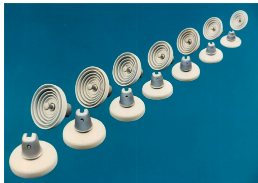
図2 代表的懸垂碍子

懸垂碍子には高い電氣的、機械的強度が要求されるため、各部材の設計に工夫がなされている。標準的な懸垂碍子で 165kN の引張荷重に耐え、内部磁器部分が電氣的に貫通する絶縁破壊強度は 140kV 以上である。