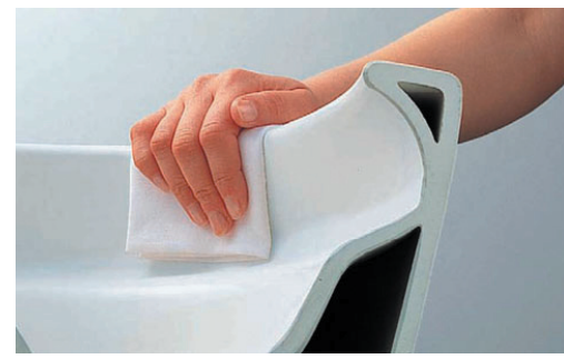
図4 大便器のフチなし形状

調製工程では、粘土や陶石、長石、ケイ石などからなる原料を、原料：水＝2：1程度の比で調合し、ボールミルなどで所定の粒径まで混合・粉碎し泥漿を作製する。