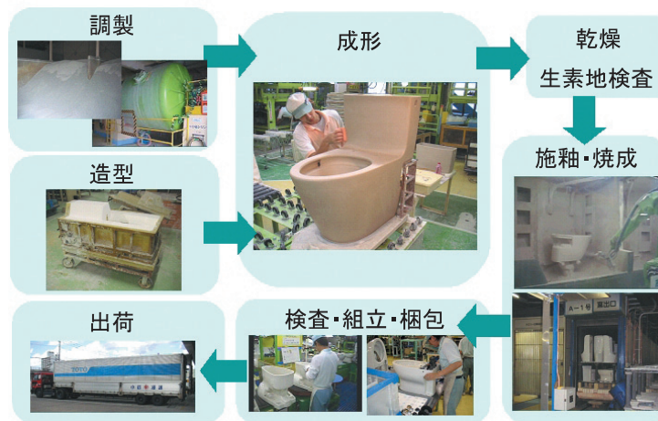
図3 衛生陶器の製造フロー(大便器)

注4 型に厚み以上の空間を設け、そこに泥漿を流し込み、型面へ所定量着肉した時点で、残りの泥漿を排出する成形方法(図2)。