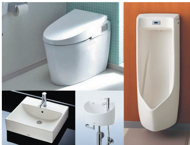
図1 水まわりにおける衛生陶器

国内においては、1912年日本陶器合名会社 注1) の製陶研究所でイギリス風便器の製法にもとづいて研究が始められ、1914年水洗式小便器を大阪市場にて試販を始めたのが最初であるといわれる。以来、特に戦後において住宅不足の解消、生活水準の向上、環境衛生の整備改善に伴い急速に普及が進み、現在ではほとんどの生活空間で使用されている。2007年の衛生陶器