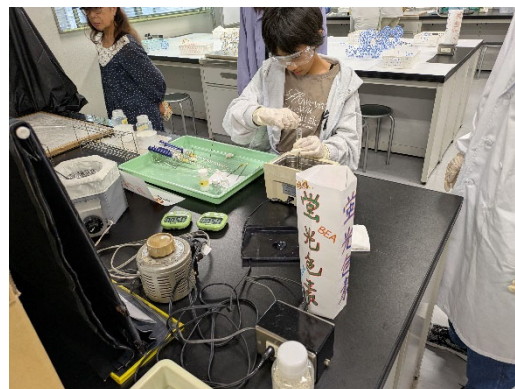
会場の様子 2 (Photo 2)