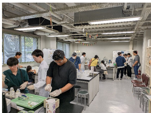
会場の様子 4 (Photo 4)