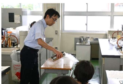
写真3 マイスナー効果の観察

YBCO セラミックを液体窒素で冷却し、その上に磁石を浮上させるマイスナー効果の実験を体験していただいた。最初に液体窒素について説明した後、YBCO セラミックを -196^{\circ}\text{C} まで冷却し、YBCO セラミックの上で磁石が静かに浮上する現象を実演した。参加者の方々は超伝導セラミックの不思議な現象に興味津々の様子であった。磁石浮上実験を順番に体験していただいた後、超伝導が生じている世界を少しでもイメージしていただくため、銅酸化物高温超伝導体のホストの一種である \text{La}_2\text{CuO}_4 の結晶構造模型の作成に取り組んでいただいた。テキストに記載した設計図を見ながら、3色の紙粘土と2種類の長さの楊枝を用いて作成いただいた。超伝導セラミックを構成する原子やイオンの繋がりをイメージし、 \text{CuO}_2 面が超伝導の現象に重要であることを感じていただけたのではないかと考えている。