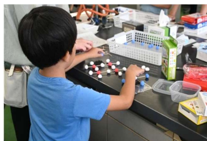
写真4 結晶構造模型の作成