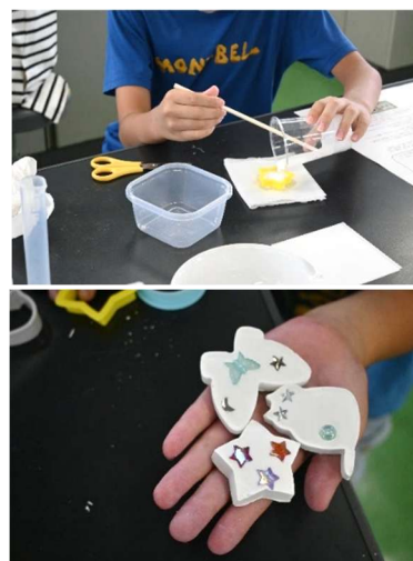
写真2 石こうマグネット作り Photo 2 Making plaster magnets