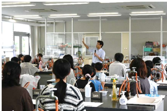
写真1 実験教室の風景（1） Photo 1 Scene (1) of the ceramics science school

地球規模でのエネルギー・環境問題の改善や超スマート社会の実現に向けて、機能性セラミックスの重要性やその役割はますます大きくなっており、機能性セラミックスの分野に少しでも興味を持っていただくため、本体験実験教室では3種類の体験テーマを準備し、テーマ毎に10分間の休憩を挟みながら約3時間の全体スケジュールで機能性セラミックスに関する体験実験に取り組んでいただいた。