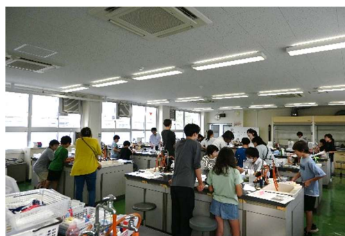
写真6 実験教室の風景（2）